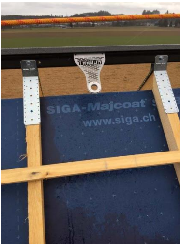
Bornack Fahrzeughalle Zuchwil06.jpg

Der Anschlagpunkt ist verschiebbar, so dass jeder Bereich auf dem Dach koordinatenmäßig angesteuert werden kann, unabhängig vom Neigungswinkel. Ohne vorbereitende Maßnahmen wird der Anseilschutz einfach in den Anschlagpunkt eingehängt.