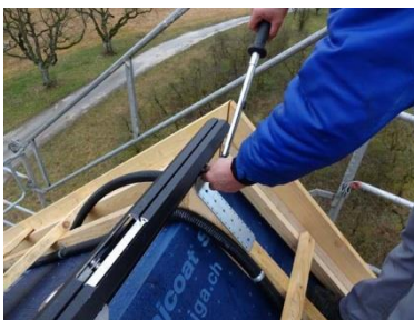
Bornack Fahrzeughalle Zuchwil07.jpg

Die Lüthi AG und BORNACK bündeln ihre Fachkompetenz und sorgen gemeinsam für eine saubere Planung und Installation der Flesst ® Schiene.