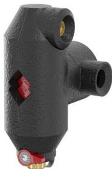
Flamco_Luft- und Schmutzabscheider_04.jpg

Flamco bietet alle seine Abscheider auf Wunsch in der EcoPlus-Variante mit einem EPP-Isoliermantel in einer Stärke von 20 Millimetern an.