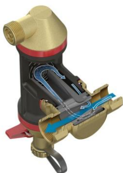
Flamco_Luft- und Schmutzabscheider_05.jpg

Die Flamco-Produkte machen sich beim Abscheiden den Venturi-Effekt zunutze. Das Trennelement im Inneren der Abscheider reduziert die Fließgeschwindigkeit des Wassers bis auf weniger als 1 Prozent von der des Hauptvolumenstroms. Dadurch können die Blasen aufsteigen und die Anlage über den Schwimmer verlassen.