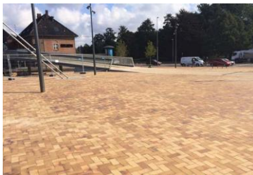
August 2015

Der Platz am südlichen Teil der Brücke ist zum Treffpunkt für Jung und Alt geworden. Nachts sorgt eine besondere Lichtinstallation für eine stimmungsvolle Atmosphäre.