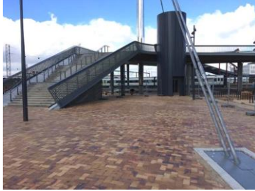
Hagemeister_Byens Bro Brücke_5.jpg

In einer leichten Wellenform führt die Byens Bro Brücke über die Gleise des naheliegenden Hauptbahnhofes von Odense.