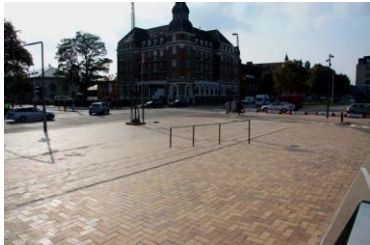
Hagemeister_Byens Bro Brücke_6.jpg

Weitläufig und großzügig präsentiert sich der südliche Platz vor der Brücke.