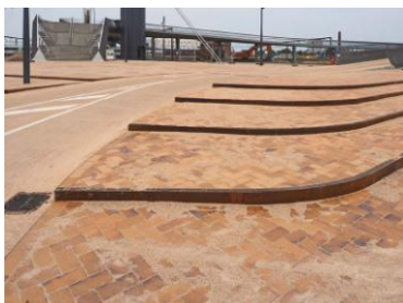
Hagemeister_Byens Bro Brücke_8.jpg

Wellenförmige Stufen greifen das Gefälle auf. Durch den Einsatz einer Begrenzung aus vorgewittertem, rostrottem Stahl entsteht gemeinsam mit dem changierenden Klinker ein lebendiges Farbspiel.