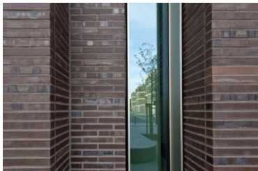
Hagemeister_Oberfinanzdir ektion Münster_6.jpg

Versetzte Fenster geben der Fassade einen lebendigen Look.