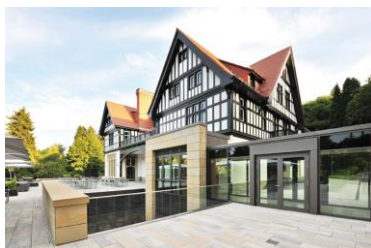
Richard Brink_Dorint-Hotel Oberursel_01.jpg

Umgeben von einer weitläufigen Parkanlage liegt das Dorint-Hotel Frankfurt/Oberursel auf einer Anhöhe. Im Außenbereich wurden hochwertige Rinnen der Firma Richard Brink verbaut, um die optimale Entwässerung zu garantieren.