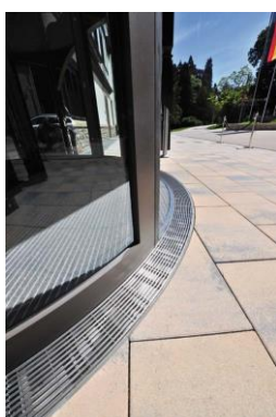
Richard Brink_Dorint-Hotel Oberursel_07.jpg

Maßangefertigte radiale Cubo-Rinnen umrahmen die Karusselltür des Eingangsbereichs und sind mit Hydra Linearis Rosten ausgelegt. Optisch ansprechend stellen sie die perfekte Entwässerung sicher.