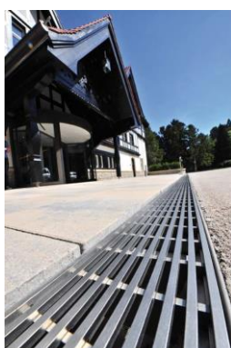
Richard Brink_Dorint-Hotel Oberursel_08.jpg

Im Außenbereich sorgt die Schwerlastrinne Ferro Magna dafür, dass auch LKW und Feuerwehrfahrzeuge problemlos das Gelände befahren können.