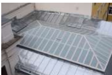
Triflex Glasdach Wien07.jpg

Dank der einfachen Verarbeitung und der schnellen Aushärtung konnten die Verarbeiter das Glasdach innerhalb kürzester Zeit dauerhaft abdichten.