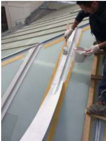
Triflex Glasdach Wien04.jpg

Durch die Vliesarmierung nimmt die Flüssigkunststoffabdichtung Bewegungen der Konstruktion schadlos auf.