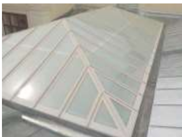
Triflex Glasdach Wien06.jpg

Schritt für Schritt wurden die einzelnen Konstruktionselemente abgedichtet: Längen, Grate, First und Traufen.