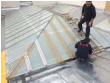
Triflex Glasdach Wien05.jpg

Die Handwerker verwendeten Dachleitern, um auf der Fläche nicht abzurutschen oder durch das Glas zu brechen.