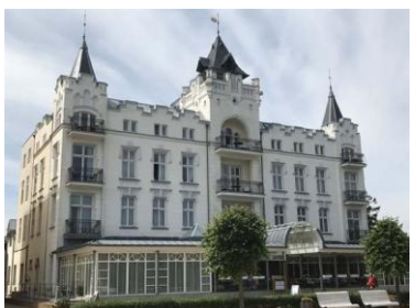
Triflex_Palace Hotel Usedom08.jpg

Nach der Sanierung mit Triflex fühlen sich die Gäste in dem 5-Sterne-Hotel wieder wohl und können die Strandlage genießen.