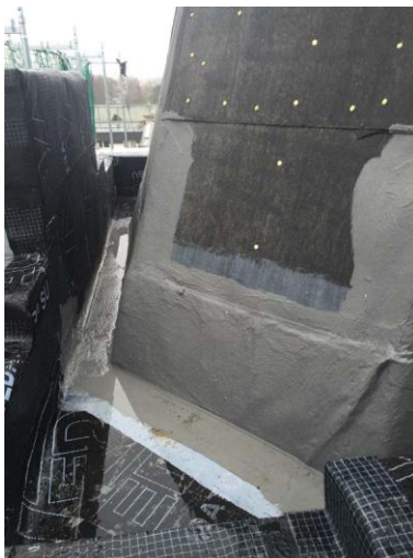
Triflex_Palace Hotel Usedom06.jpg

Besonders bei komplizierten Geometrien wie Bauteil-Übergängen, Hochzügen etc. spielt das Detail Abdichtungssystem seine Stärken aus. Es haftet auf nahezu allen Materialien und gleitet selbst von senkrechten Flächen nicht ab, da es werkseitig thixotropiert ist.