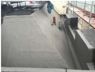
Triflex_Palace Hotel Usedom05.jpg

Triflex ProDetail wird flüssig appliziert und legt sich wie eine zweite Haut an alle baulichen Gegebenheiten an. Es entsteht eine nahtlose, dauerhaft dichte Fläche.