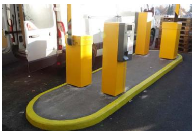
Triflex Parkhaus Kaufbeuren08.jpg

An den Ein- und Ausfahrten wurden ebenfalls gelbe Markierungen eingesetzt. Das Gesamtbild des Parkhauses wirkt wieder hell und freundlich.