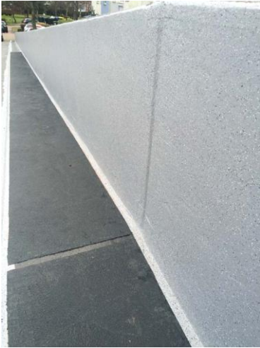
Triflex Parkhaus Wolfsburg06.jpg

In die Abdichtung eingestreute Triflex Micro Chips werfen die innenliegenden Mauerabschnitte optisch auf.