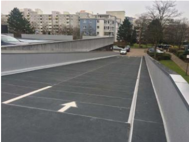
Triflex Parkhaus Wolfsburg07.jpg

Weißer Markierungen dienen den Pkw-Fahrern als Orientierung.