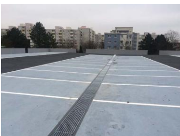
Triflex Parkhaus Wolfsburg10.jpg

Gemeinsam haben Triflex, die Firma Holl Flachdachbau, die BUWOG Immobilien Management GmbH und die Eigentümergemeinschaft für das Parkhaus eine Lösung entwickelt, die dem gewünschten Kosten-Nutzen-Verhältnis entspricht.