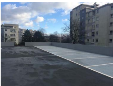
Triflex Parkhaus Wolfsburg09.jpg

Die hell gestalteten Parkflächen heben sich von der dunklen Nuttschicht des Fahrbelags ab.