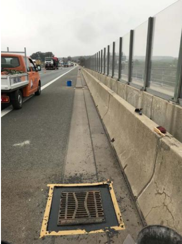
Triflex Tautendorfer Brücke04.jpg

Bereits nach 45 Minuten war die Kiesmischung ausgehärtet und die Sanierer konnten mit dem Eindichten der Straßenabläufe fortfahren. Dafür kam Triflex Cryl Vergussmörtel auf Basis von Polymethylmethacrylat (PMMA) zum Einsatz.