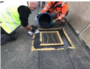
Triflex Tautendorfer Brücke06.jpg

Um den tiefer liegenden Straßenablauf an das Niveau der Asphaltdeckschicht anzupassen, hat das Team der TSI eine zweite Schicht Triflex Cryl Vergussmörtel, vermengt mit Stellmittel, aufgebracht.