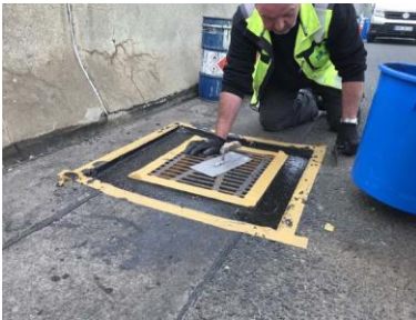
Triflex Tautendorfer Brücke05.jpg

Das Spezialharz wird direkt auf der Baustelle angemischt und kalt appliziert. Das spart im Vergleich zu Gussasphalt Zeit und Kosten.