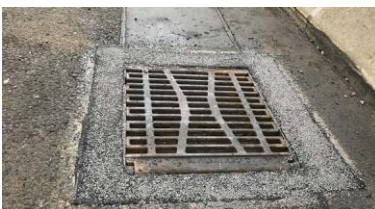
Triflex Tautendorfer Brücke07.jpg

Aus optischen Gründen haben die Verarbeiter die letzte Vergussmörtel-Lage in noch frischem Zustand mit feinem Splitt abgestreut.