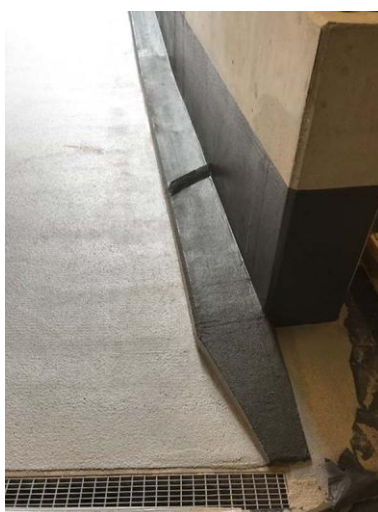
Triflex Tiefgarage Spindlershof06.jpg

Dank integrierter Detailabdichtung mit Vliesarmierung entsteht mit Triflex ProDeck ein hochwertiger Bauwerksschutz, der vor Rissbildung bewahrt und die Sanierungsintervalle um viele Jahre verlängert.