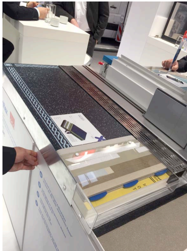
Triflex BAU 2017_04.jpg

Um dem Fachpublikum zu demonstrieren, wie der Schichtenaufbau eines Abdichtungssystems aus einem durchgehenden Werkstoff wie Polymethylmethacrylatharz (PMMA) aussieht, hatte Triflex anschauliche Exponate im Messegepäck.