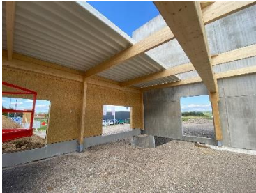
Kingspan_ KS1000 X-Dek 108_04.jpg

Als fertiges Systembauteil ermöglicht das X-Dek™ 108 eine wesentlich einfachere und schnellere Installation als andere Produkte, insbesondere Mehrschicht-Systeme. Die Verlegung erfolgt von Binder zu Binder bzw. von First zu Traufe.