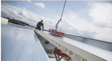
Kingspan_ KS1000 X-Dek 108_01.jpg

Das KS1000 X-Dek™ von Kingspan ist ein Flachdachsystem, das höchste Anforderungen an Tragfähigkeit, Festigkeit und Dicke der Wärmedämmung erfüllt.