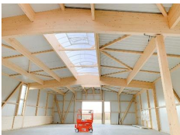
Kingspan_ KS1000 X-Dek 108_03.jpg

Durch seine herausragenden Eigenschaften in Sachen Sicherheit, Zeitersparnis und Flexibilität erweist sich das System als Joker für die Planung und Montage von Flachdächern, insbesondere im Holzbau.