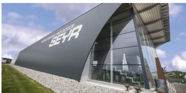
Kingspan_ KS1000 X-Dek 108_05.jpg

Die Oberseite der X-Dek-Paneele kann für das Aufbringen verschiedener Dichtungsbahnen vorbereitet werden. So erhalten Planer maximale Flexibilität bei der Wahl der bevorzugten Abdichtungen.