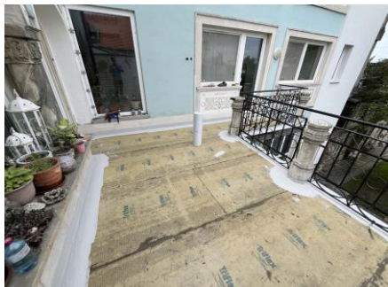
Triflex_Balkonsanierung g Wohnhaus_ProDrain0 4.jpg

Die Abdichtung der Details wie Säulen und Anschlüsse wurde mit dem vollflächig vliesarmierten Triflex ProDetail durchgeführt. Dieses verfügt über ein Spezialvlies, das in zwei Schichten in das flüssige Harz eingelegt wird und dem Material Elastizität verleiht.