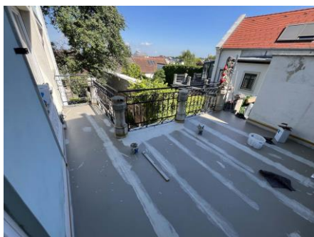
Triflex_Balkonsanierung g Wohnhaus_ProDrain0 5.jpg

Die Flächenabdichtung erfolgte mit Triflex ProTerra. Unebenheiten besserten die Verarbeiter mit einem Cryl Spachtel aus, bevor anschließend die Nutzschicht mit Triflex ProFloor hergestellt wurde.