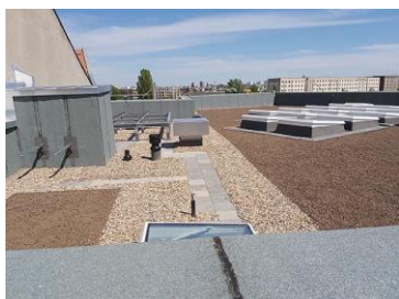
Triflex_ Abdichtung Dachbegrünung_06.jpg

Die Detailabdichtung ist nach EN 13948 wurzel- und rhizomfest und somit bestens für den Einsatz unter einem Gründach geeignet. Sie schützt auch komplizierte Geometrien zuverlässig und langfristig.