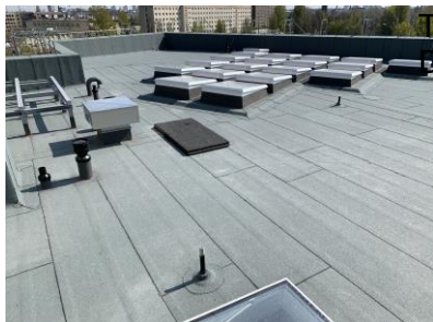
Triflex_ Abdichtung Dachbegrünung_05.jpg

Triflex ProDetail kann bei Untergrundtemperaturen von bis zu -5\text{ }^{\circ}\text{C} verwendet werden. Da die Dacharbeiten in den Winter bzw. Frühling fielen, war dies entscheidend. Ein weiterer Vorteil des Materials ist seine schnelle Reaktionszeit.