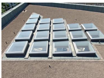
Triflex_ Abdichtung Dachbegrünung_07.jpg

Andreas Unversucht, Geschäftsführer der für die Dacheindeckung verantwortliche Universum Dachbau GmbH, ist mit dem Ergebnis sichtlich zufrieden: „Triflex ProDetail ist eine schnelle, sichere und saubere Abdichtung, die große und kleinere Einbauteile zuverlässig und langfristig schützt.“