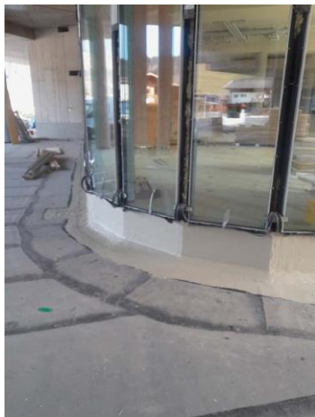
Triflex_Terrasse Mietshaus Aschau_04.jpg

Das Ergebnis überzeugt Bauleiter, Verarbeiter und Bauherr. Die naht- und fugenlose Fläche sichert die Terrasse nachhaltig ab.